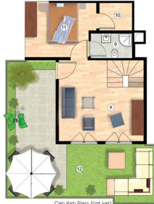
Çatı Katı Planı (üst kat) Roof Floor Plan (upstairs)