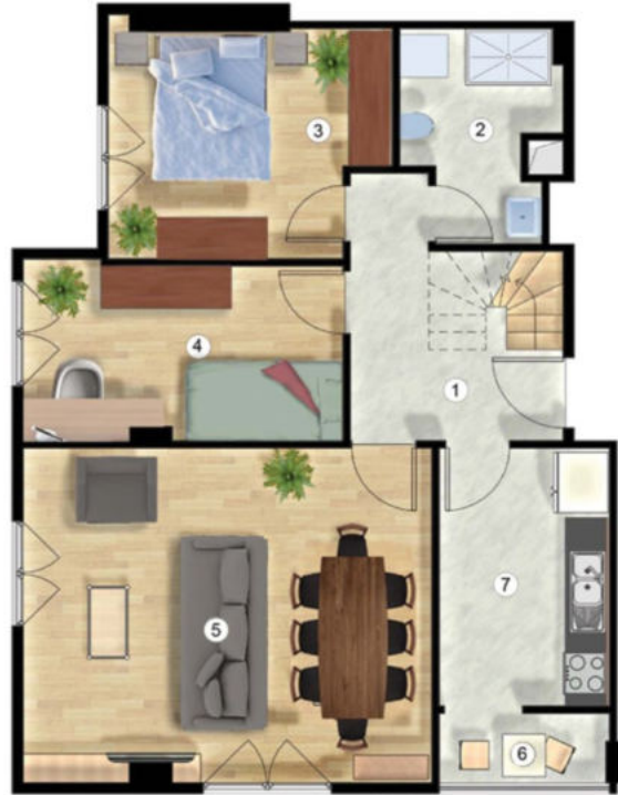
Normal Kat Planı (alt kat) Flat Floor Plan (downstairs)