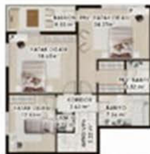
VILLA TAŞAM ALANI NORMAL 1. KAT PLANI