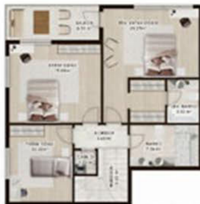
VILLA SADAY ALANG 1000SQM PLOT