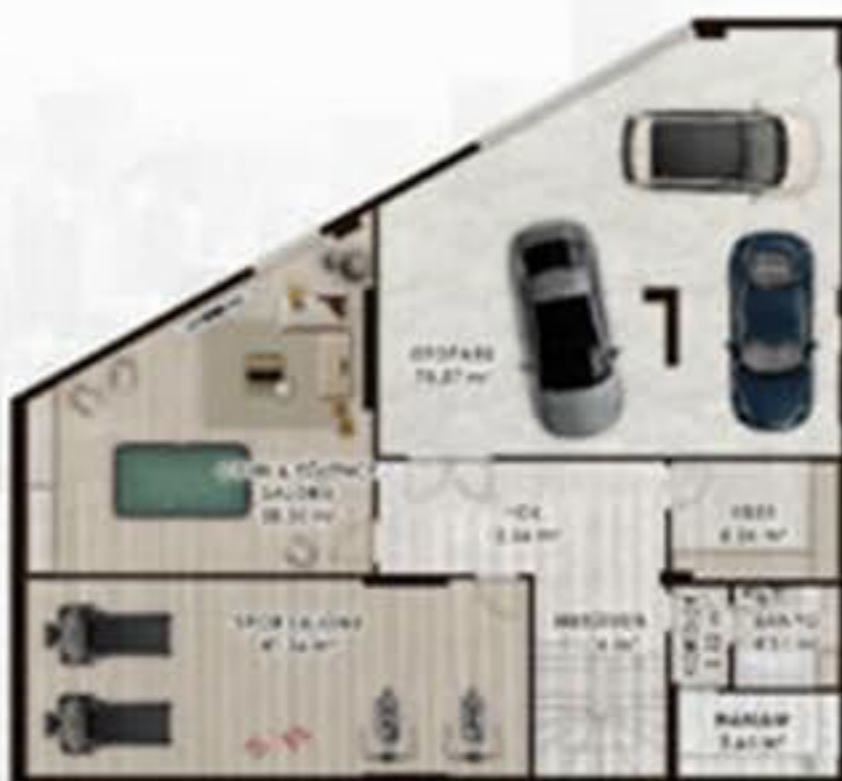
VILLA TAŞAM ALANI NORMAL 1. KAT PLANI