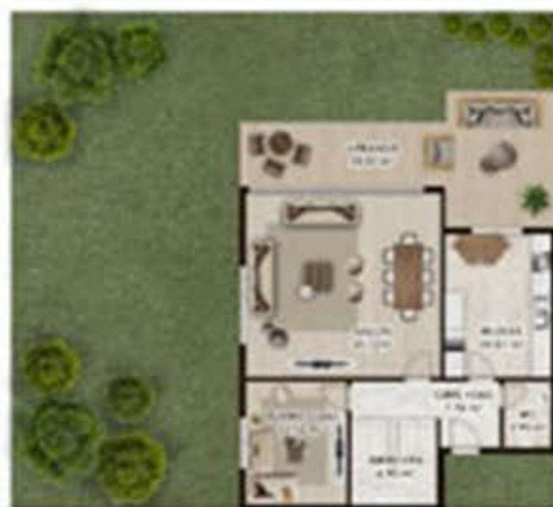
VILLA SADAY ALANG 2000 SQM PLOT