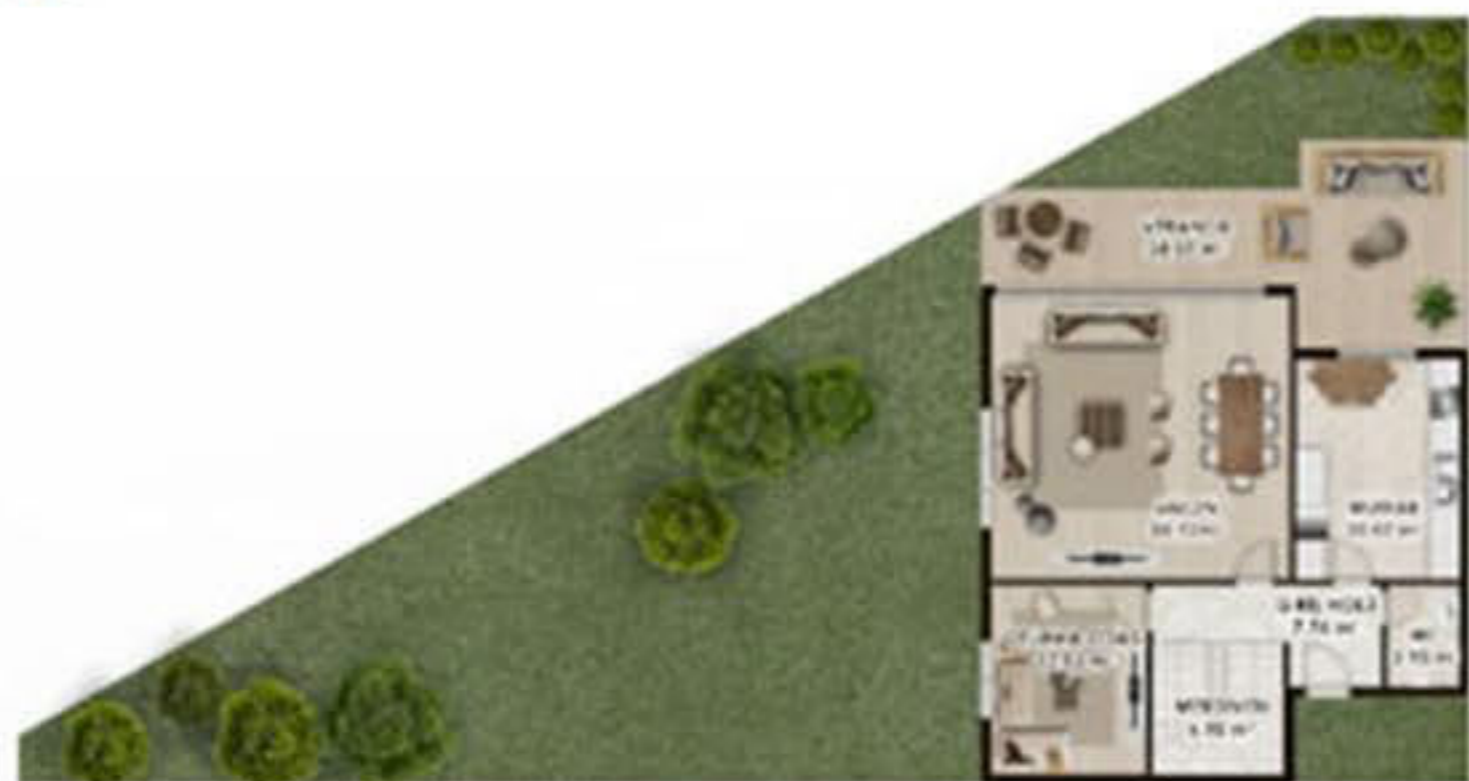
VILLA TAŞAM ALANI ZİNNİN 1. KAT PLANI