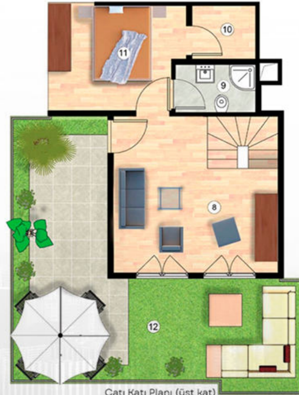
Çatı Katı Planı (üst kat) Roof Floor Plan (upstairs)