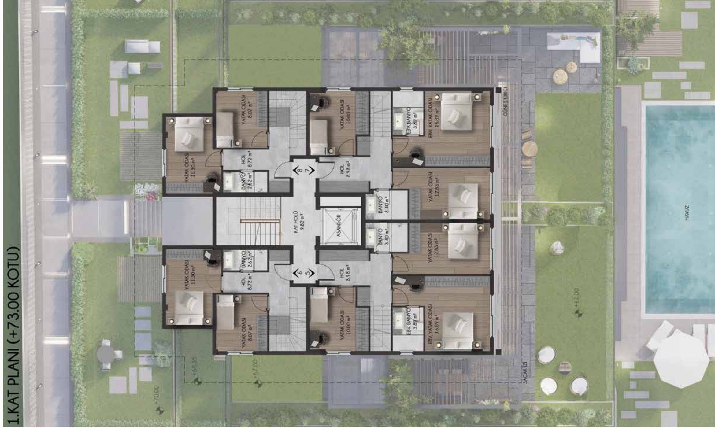
1.KAT PLANI (+73.00 KOTU)